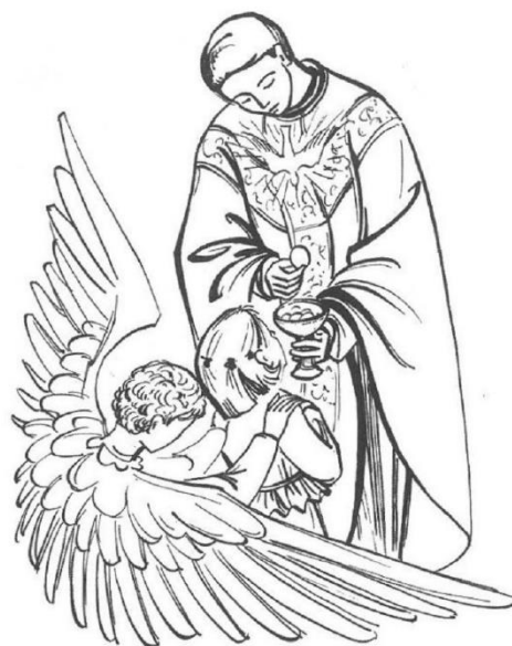
Ton Ange t'accompagne jusqu'à Jésus

2. Mon Père, mon Père, en toi je me confie, En tes mains, je mets mon esprit. Je te le donne, le cœur plein d'amour. Je n'ai qu'un désir : t'appartenir.